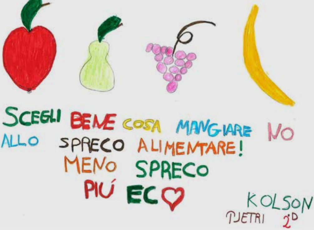
Kolsom Pjetri 2D Don Milani